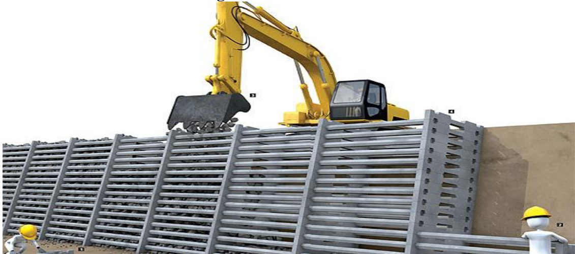
Figura 6 - CRIB-WALLS