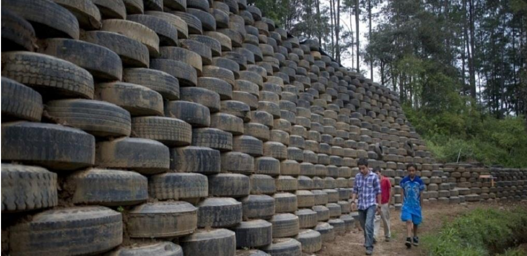
Figura. 4 – Muro de pneus