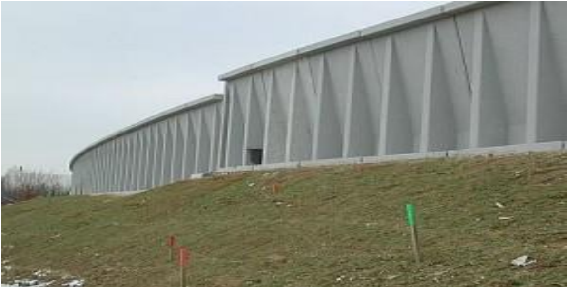
Figura. 7 - Muro de concreto armado