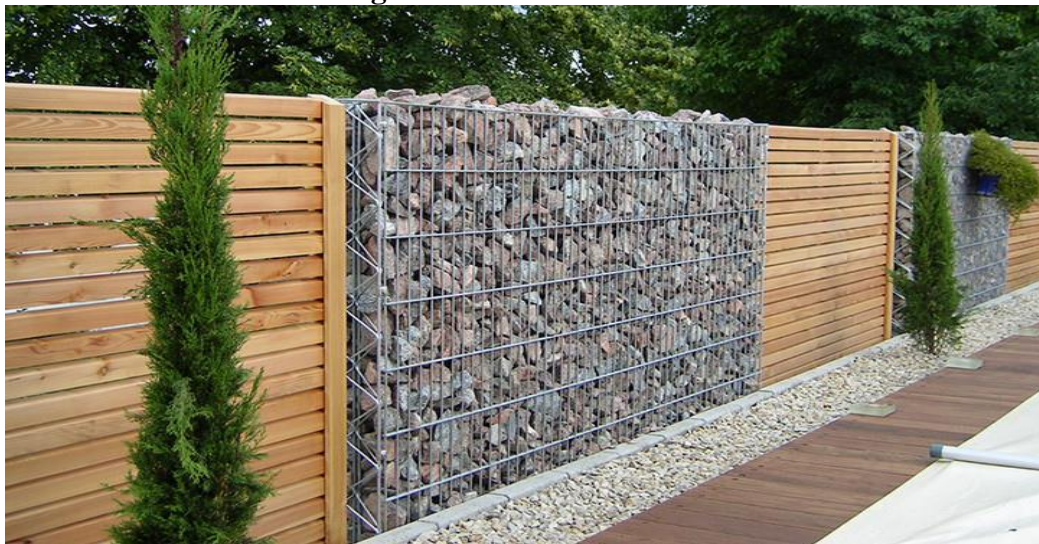
Figura. 2 – Muro de Gabião

São conhecidos pelo seu formato de caixas ou “gaiolas”, podendo ser construídos de arame galvanizado, preenchidos com pedras de britas ou seixos conforme ilustra Figura 2. Podem ser costurados por arame.