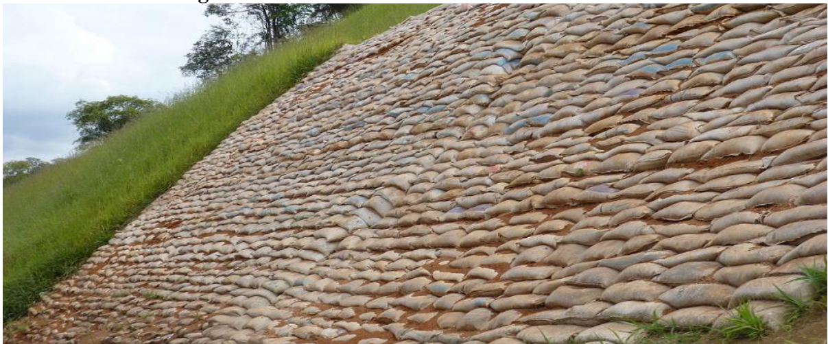
Figura. 5 - Muro de sacos de solo-cimento ensacados

Pode ser usado com a finalidade de proteger o talude. É uma solução prática e segura para conter terrenos inclinados com alto desnível conforme ilustra a Figura 5.