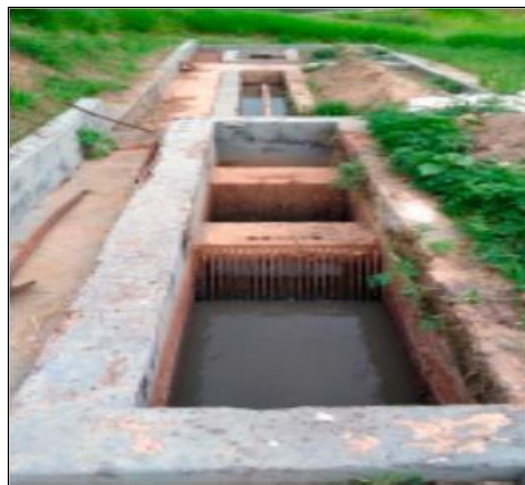
Figura 2 - Vista do Tratamento Preliminar da ETE de Oriente/SP.

As figuras de 2 a 6 demonstram algumas partes constituintes do sistema de tratamento de oriente.