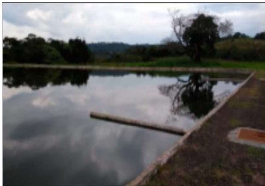
Figura 4 - Vista da lagoa facultativa da ETE de Oriente/SP