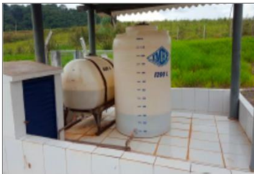
Figura 6 - Vista do sistema de desinfecção por cloro da ETE de Oriente/SP