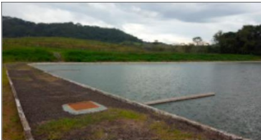
Figura 5 - Vista da lagoa de maturação da ETE de Oriente/SP