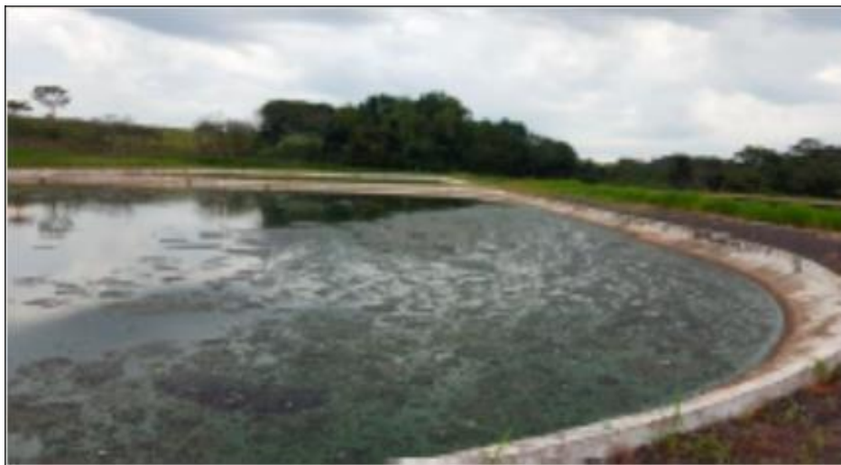
Figura 3 - Vista da lagoa anaeróbia da ETE de Oriente/SP